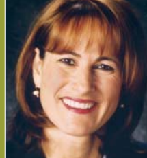
Kathleen Weil Présidente et directrice générale

Chaque nouvel exercice de notre jeune fondation a été marqué de premières. L'exercice 2005 ne fait pas exception. Cette année, en plus de connaître une croissance soutenue, nous avons réussi à réaliser l'un de nos grands objectifs : élargir notre champ d'action afin de couvrir tous les volets de la vie communautaire.